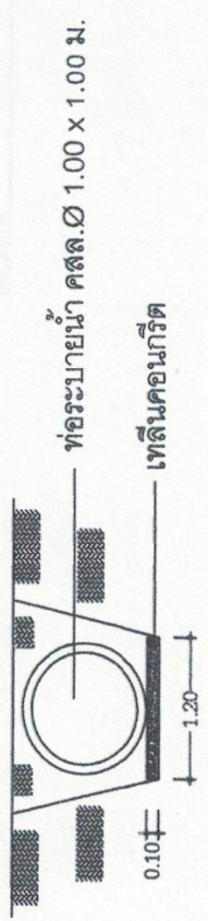
รูปตัดงานวางท่อ SCALE _____ NOT